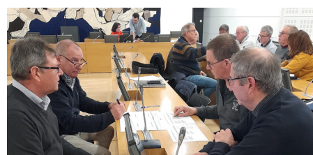
Ateliers mobilités, 22 mars 2023