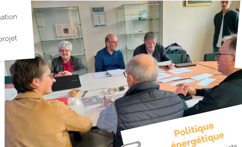
Ateliers PADD Warluis, 31 mars 2023