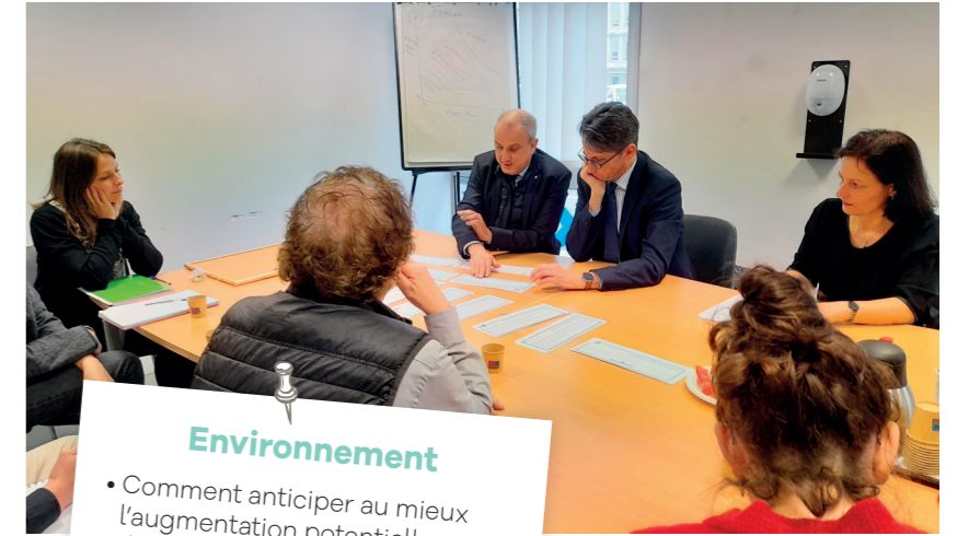
Ateliers PADD Beauvais, 29 mars 2023