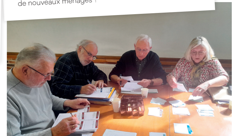
Ateliers PADD Warluis, 31 mars 2023