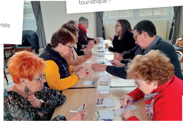
Ateliers PADD Bresles, 31 mars 2023