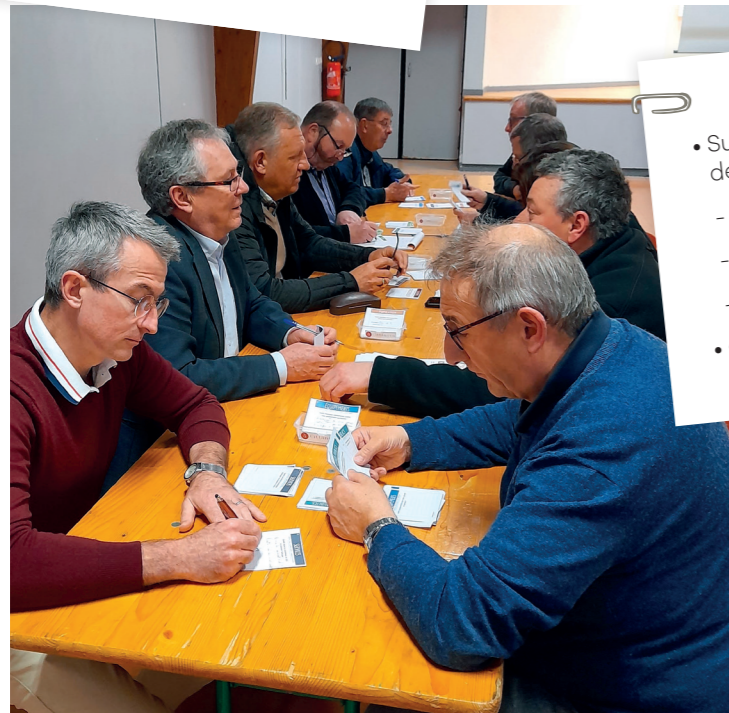
Ateliers PADD Troissereux, 30 mars 2023