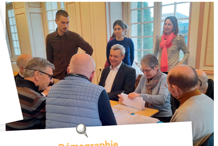
Ateliers PADD Crèvecœur-le-Grand, 30 mars 2023