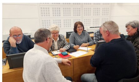
Ateliers mobilités, 22 mars 2023

Un service apprécié qui peut répondre à plusieurs besoins identifiés sur le territoire, mais qui devra se développer davantage via la création d'un maillage d'aires de covoiturage.