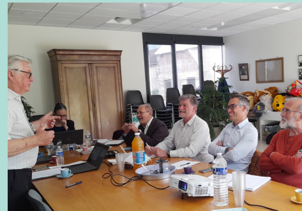
Therdonne, 24 mai 2023