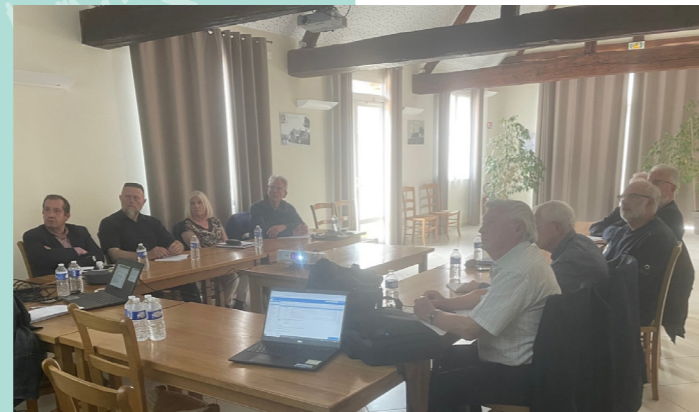
Aux Marais, 24 mai 2023