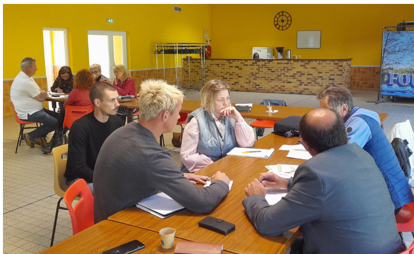
Seconde rencontre à Fouquénies, 25 mai 2023