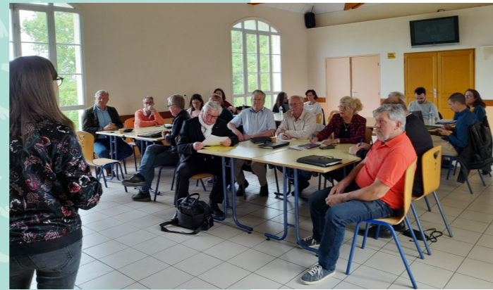
St-Germain la Poterie, 23 mai 2023