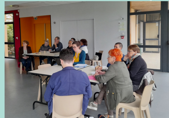
Bonlier, 23 mai 2023

Lors de 6 nouvelles réunions sectorielles les 23 et 24 mai 2023, les élus ont pu prendre connaissance de la version zéro du projet d'aménagement et de développement durables (PADD). Les communes d'accueil étaient Bonlier, Saint-Germain la Poterie, Beauvais, Francastel, Therdonne et Aux Marais.