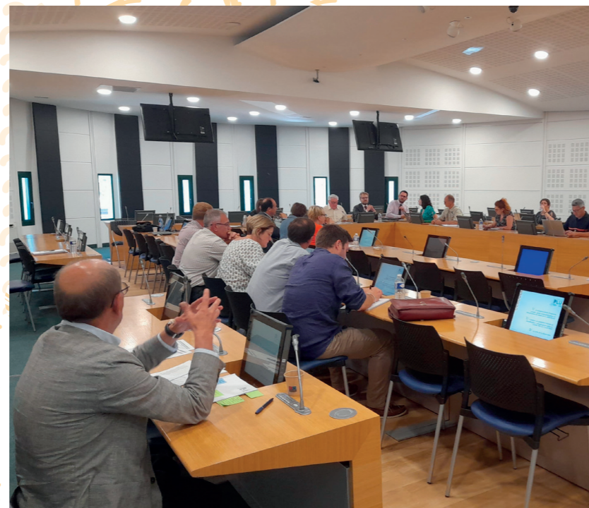
Comité de pilotage, siège de la CAB

La présentation du calendrier, des méthodes de travail et des résultats : analyse du potentiel foncier en densification, inventaire des zones d'activité économique d'intérêt intercommunal, requalification de la ZAC de Ther, « coups partis », construction du projet d'aménagement et de développement durables, calcul de la consommation d'espaces passés