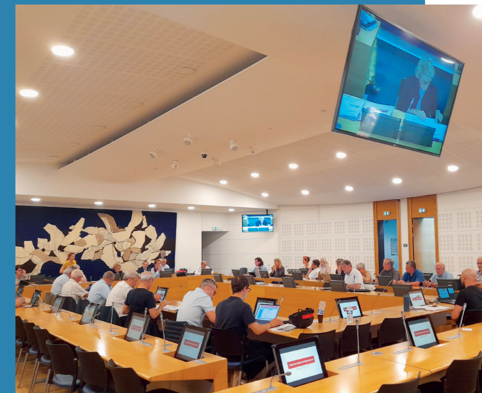
Bureau communautaire, siège de la CAB

Le bureau communautaire se réunit pour veiller à la cohérence de l'élaboration du projet de PLUi-HM. A ce jour, cette instance de validation a été consultée par 3 fois : le 20 mars 2023, le 19 juin 2023 et le 6 juillet 2023. Plusieurs sujets d'importance ont été successivement abordés à ce jour : le principe de l'équation du zéro artificialisation nette, celui des coups partis qui entrent dès à présent dans le décompte du ZAN, l'analyse du potentiel foncier en densification, les objectifs en matière de logements, le calcul de la consommation d'espaces passés et future, ou encore les déclinaisons spatiales du besoin en logements (territorialisation, densités, extensions).