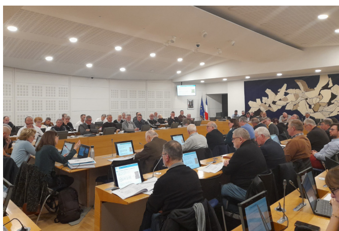
Séminaire des maires, 20 février 2024

|| Pour aider les élus à faire leurs choix dans une vision objective, 2 éléments doivent prévaloir : la répartition des logements à produire selon l'armature territoriale et le code couleur de l'analyse multicritère ||