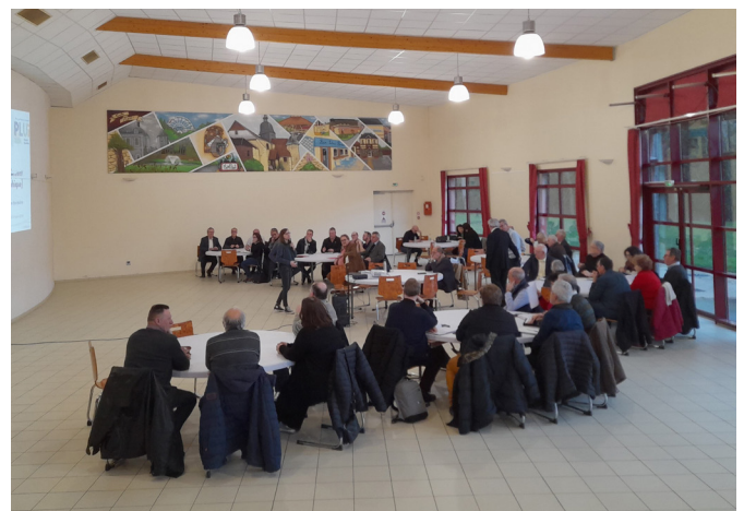
Séminaire des maires, 5 mars 2024