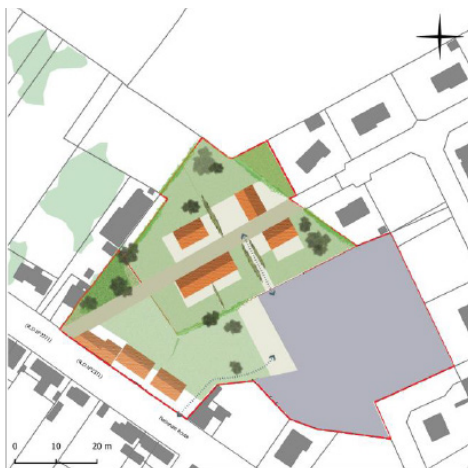
Exemple d'OAP sectorielle

En ce qui concerne les OAP dites thématiques , il s'agit d'un outil un peu nouveau. Elles s'entendent en effet à l'échelle de l'agglomération, afin de décliner certaines orientations du PADD (par exemple la trame verte et bleue ou les commerces).