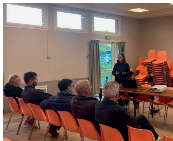
Francastel, le 2 octobre 2024