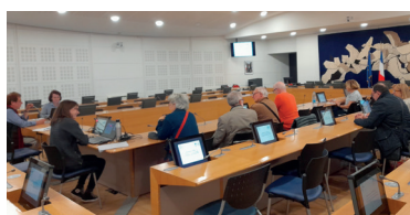
Beauvais, le 16 octobre 2024