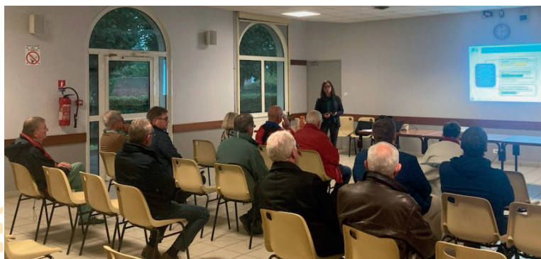
Auteuil, le 9 octobre 2024

6 nouvelles réunions publiques se sont tenues en octobre 2024 à Francastel, Savignies, Auteuil, Rochy-Condé, Bonlier et Beauvais. Les habitants et les acteurs locaux ont ainsi pu prendre connaissance des 2 principes clés du PLUi-HM du Beauvaisis, à savoir la prise en compte du zéro artificialisation nette (ZAN) et du principe d'évitement des zones à enjeux environnementaux .