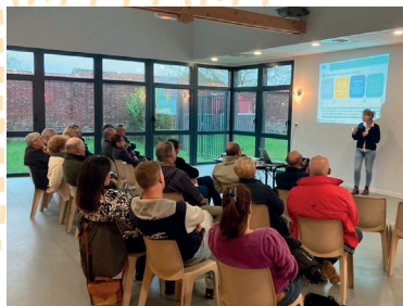
Bonlier, le 15 octobre 2024