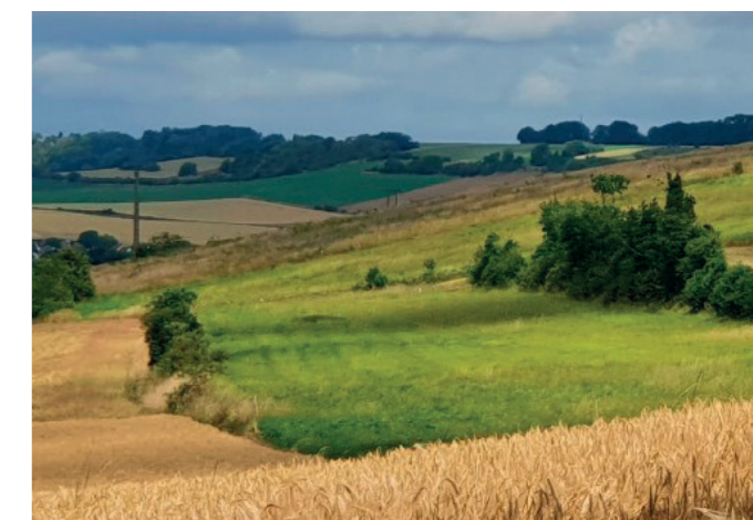
Butte des Marais, un site remarquable de larris thermo-calciicole (Aux Marais)