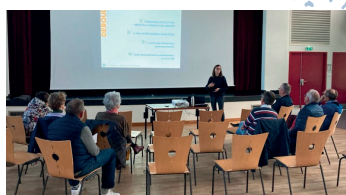
Savignies, le 8 octobre 2024