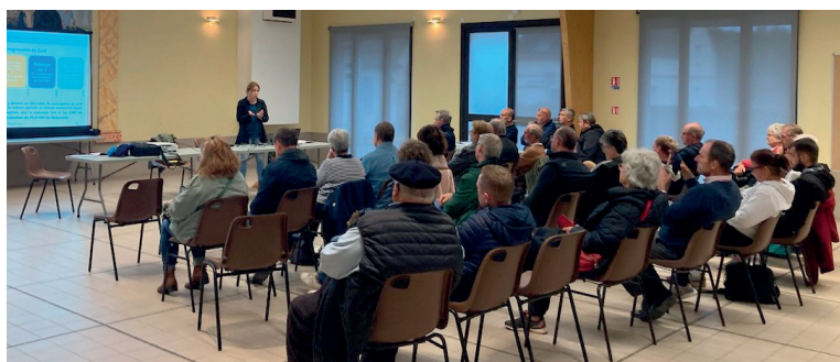
Rochy-Condé, le 14 octobre 2024